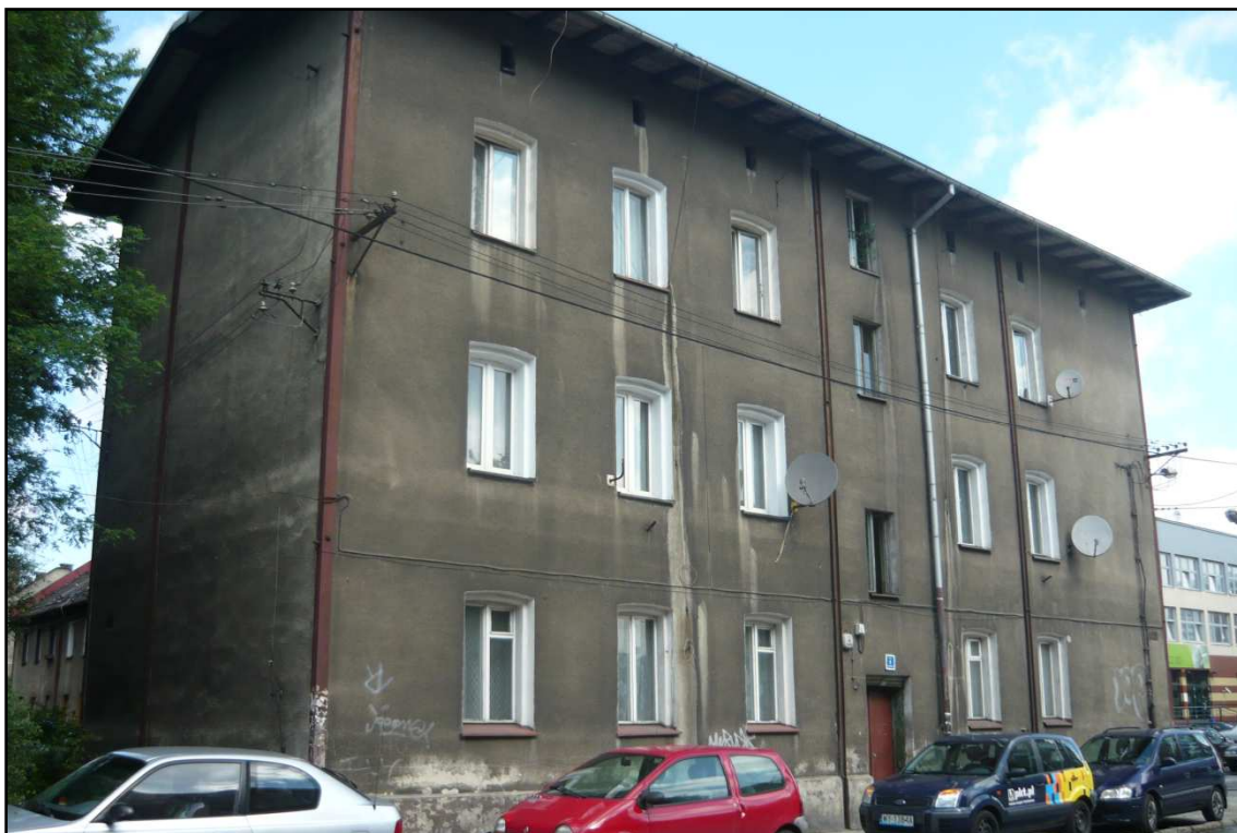
Fot. 1 Budynek przy ul. Dąbrówki 8. Elewacja południowo-zachodnia i południowo-wschodnia.