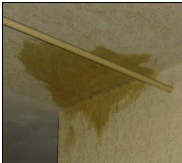
Fot. 17 Fot. 18. Widok spękań sufitu w piwnicy oraz zawilgocenie stropu nad parterem.