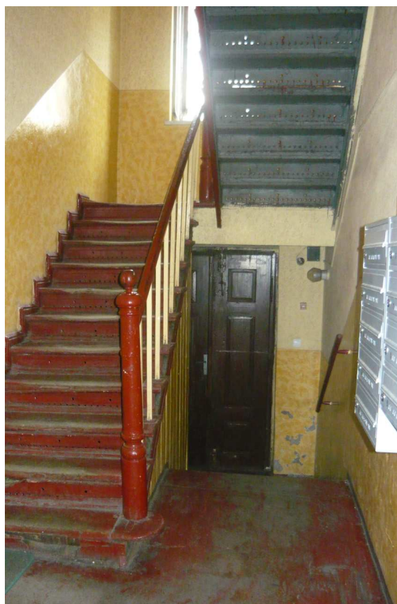
Fot. 19 Fot. 20. Zużycie techniczne biegów schodowych zewnętrznych i wewnętrznych.