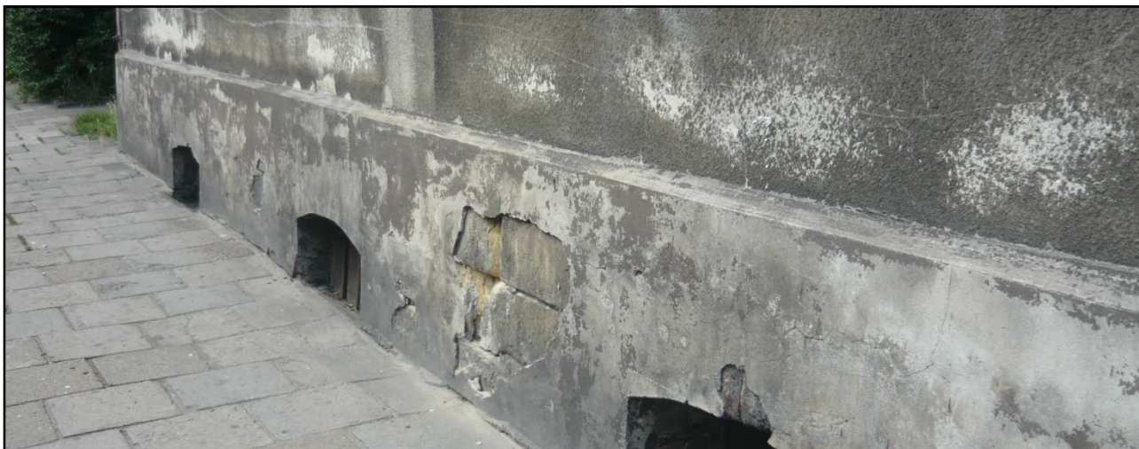
Fot. 10 Budynek przy ul. Dąbrówki 8. Zniszczenia strefy cokołu.