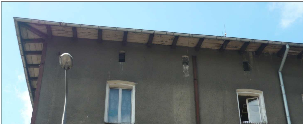
Fot. 5 Budynek przy ul. Dąbrówki 8. Korozja biologiczna więźby dachowej.