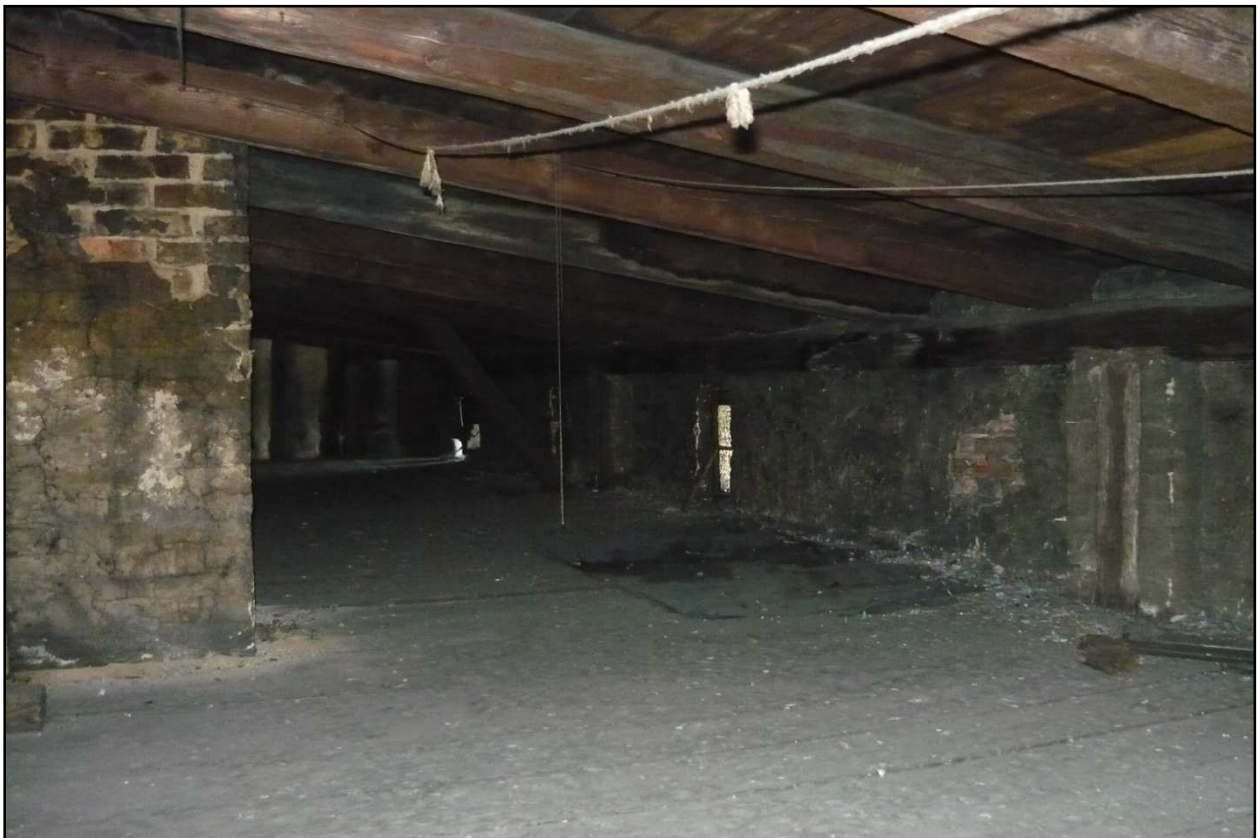
Fot. 9 Budynek przy ul. Dąbrówki 8. Porażenie biologiczne więźby dachowej, uszkodzenie ściany zewnętrznej, spękania na kominie.