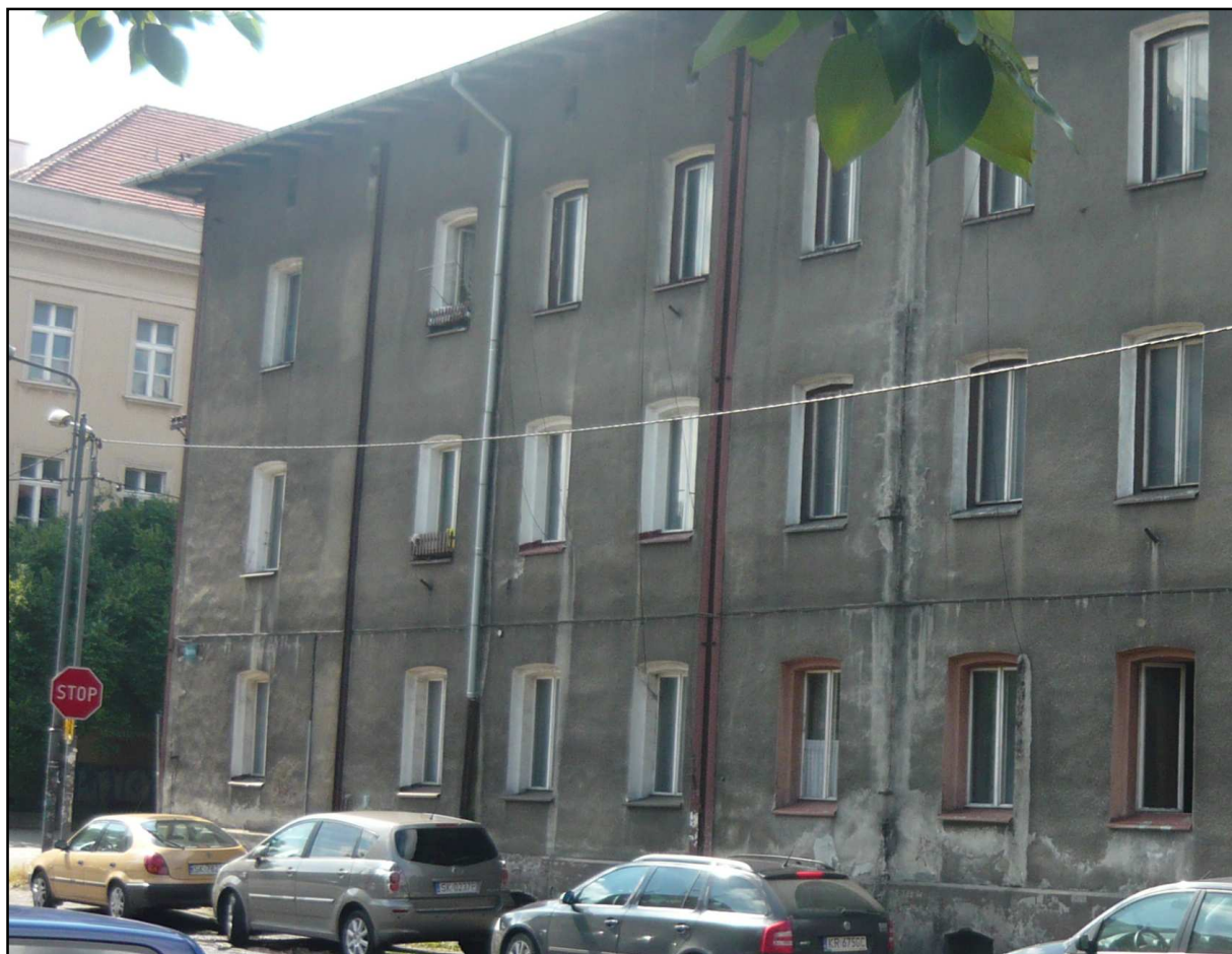
Fot. 3 Budynek przy ul. Dąbrówki 8. Elewacja północno-wschodnia.