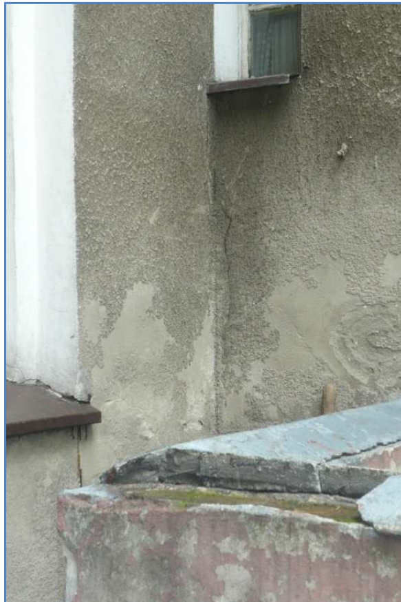
Fot. 13 Fot. 14 Budynek przy ul. Dąbrówki 8. Rysy i pęknięcia na elewacji.