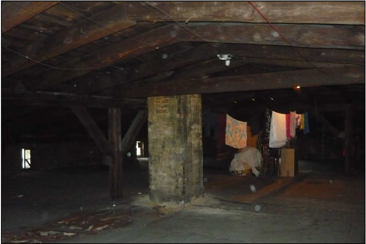
Fot. 8 Budynek przy ul. Dąbrówki 8. Porażenie biologiczne więźby dachowej, uszkodzenie stropu, spękania na kominie.