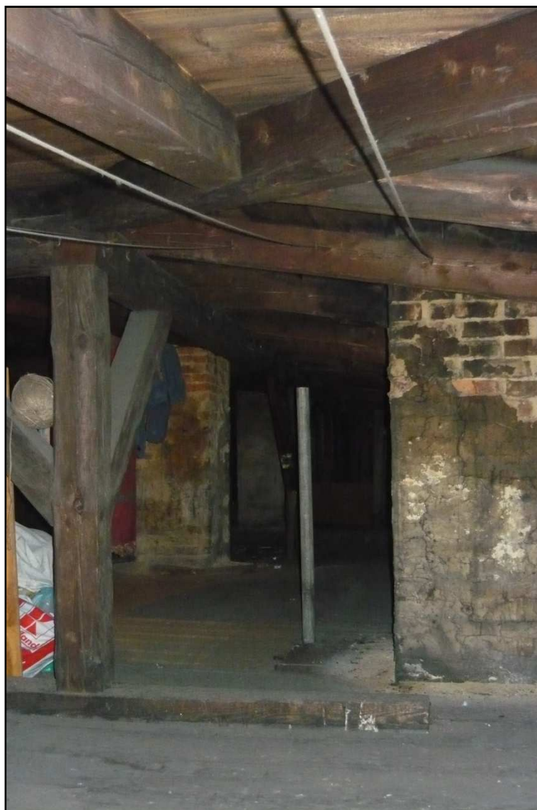
Fot. 6, Fot. 7 Budynek przy ul. Dąbrówki 8. Korozja biologiczna więźby dachowej, spękania tynków na kominie.