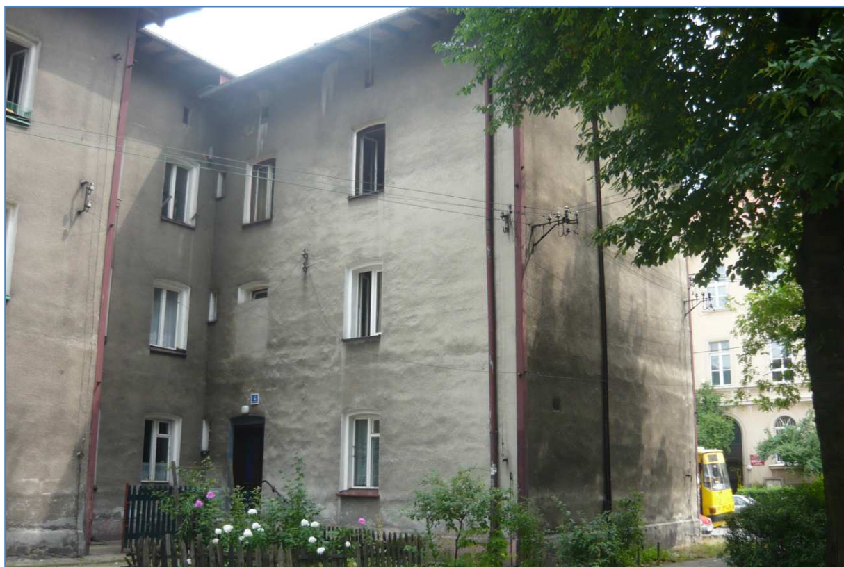
Fot. 4 Budynek przy ul. Dąbrówki 8. Elewacja północno-zachodnia i południowo-zachodnia.