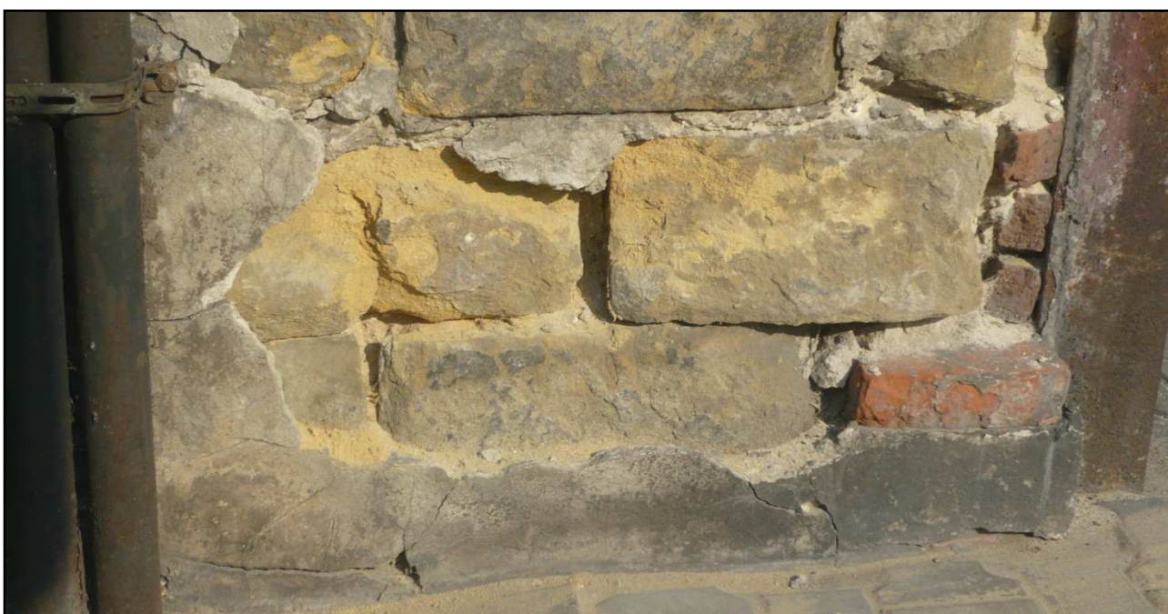
Fot. 12 Budynek przy ul. Dąbrówki 8. Zniszczenia strefy cokołu.