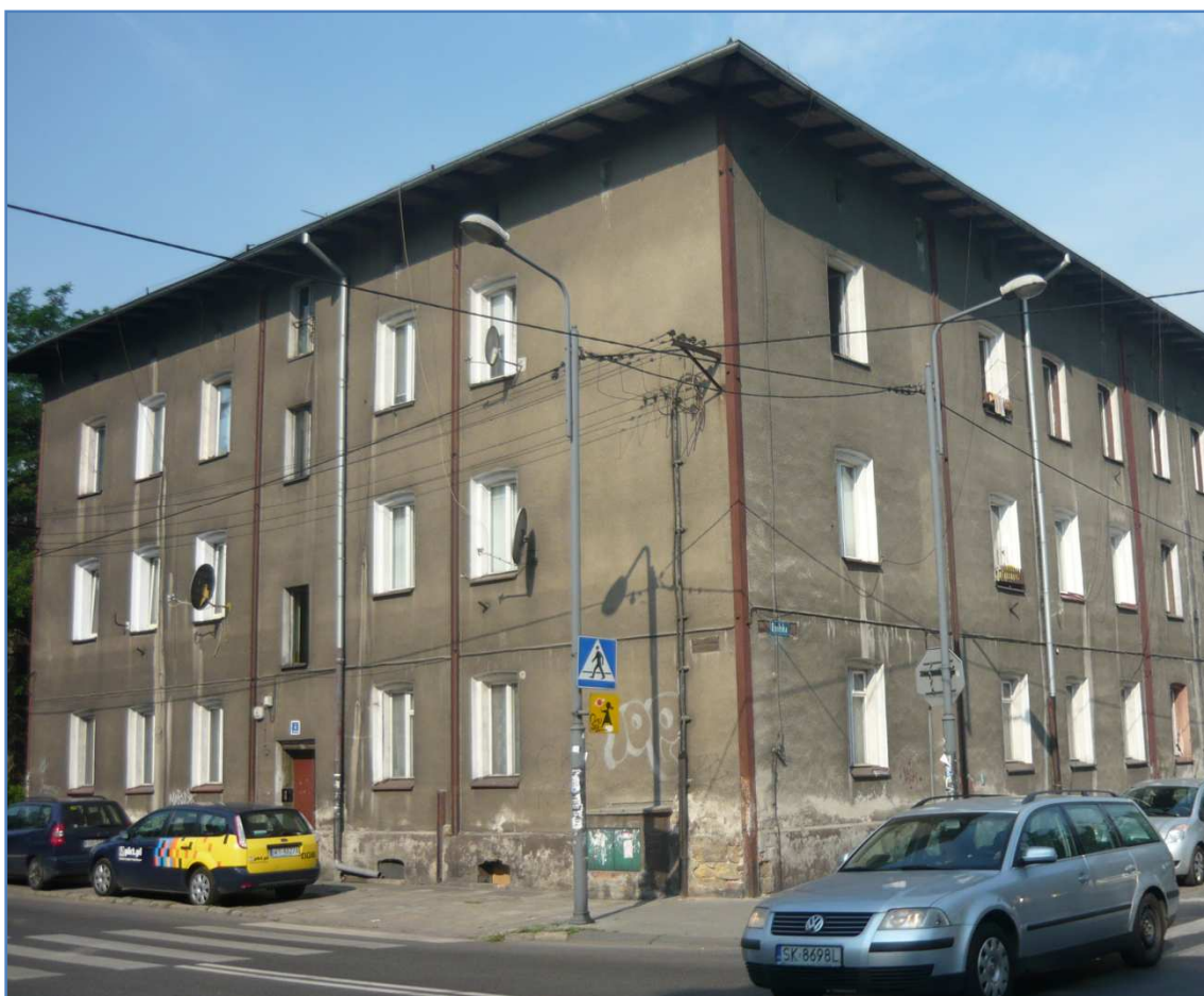
Fot. 2 Budynek przy ul. Dąbrówki 8. Elewacja południowo-wschodnia i północno-wschodnia.