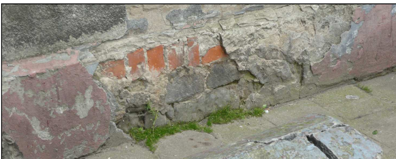
Fot. 11 Budynek przy ul. Dąbrówki 8. Zniszczenia strefy cokołu.